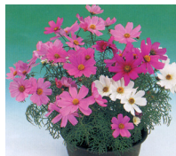
コスモス・スーパーミックス 75～80日 4/24播種－7月下旬出荷 7月播種－10/30出荷