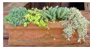
セダム 90日以上 7月挿し木－11月出荷