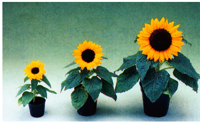
グッドスマイル 4/24播種－6/26ピンチー7月下旬出荷